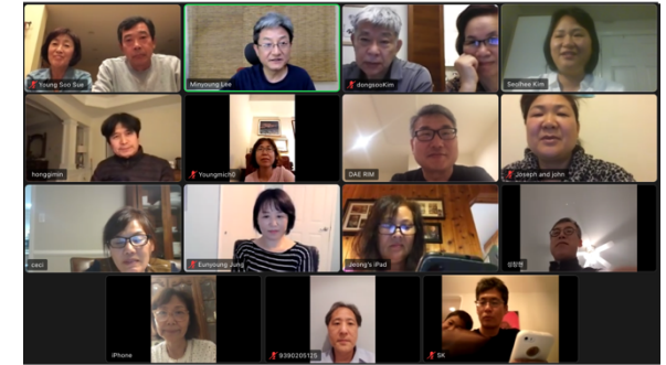
<새가정 환영 모임>