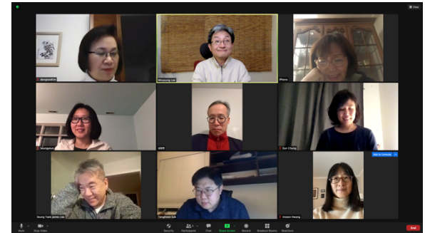
<역사서와 선지서 성경공부 / Feb. 3rd, 2021>